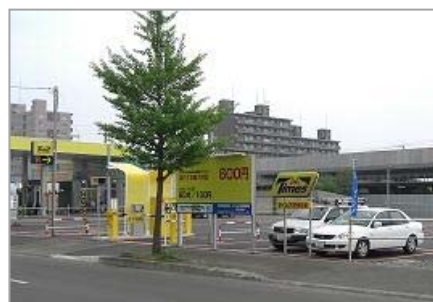
▲タイムズ野幌駅前

住所 : 北海道江別市野幌町33 収容台数 : 53台 営業時間 : 24時間 駐車料金 : 終日60分 100円 当日1日最大料金600円(24時迄) 優待料金 : 駐車料金から100円差し引いた料金にご優待