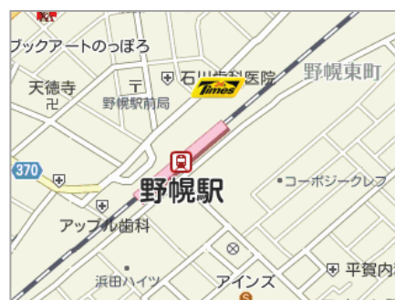
▲タイムズ野幌駅前 地図